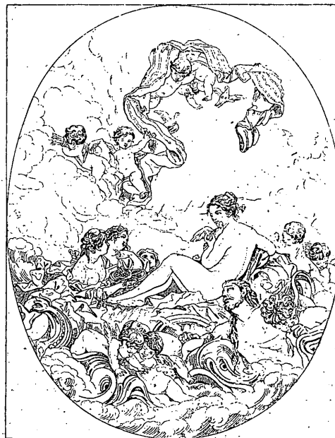
g. 367. — La naissance de Vénus (d'après un tableau de Boucher).

La siguiente particularización del enigma es la identificación con el misterio del eterno femenino (Giordano 1979: 152). 12 Esta intervención se inicia con Neso quien, según el mito, rapta a Deyanira; el intertexto cultural asienta caracterizaciones generales de lo femenino que se resemantiza, además, conjugando las imágenes finiseculares de femme angelical (“claridad de estrella”) y femme fatal (introducida con imágenes olfativas que remiten a la pulsión sexual, a lo animal: “Mi espalda aún guarda el dulce perfume de la bella”; “¡Oh aroma de su sexo!”). Ambos tópicos confluyen hacia el final de la estrofa por la conjunción sintáctica: (“¡Oh rosas y alabastros! / ¡Oh envidia de las flores y celos de los astros!”) pues con “perfume” se retoma lo erótico consolidado por “rosas”, símbolo del erotismo desde el prerrafaelismo (Bornay 2004 [1990]: 161) y con “astros” —repetido en eco en “alabastros”— se trae el vínculo con lo “angelical”. La