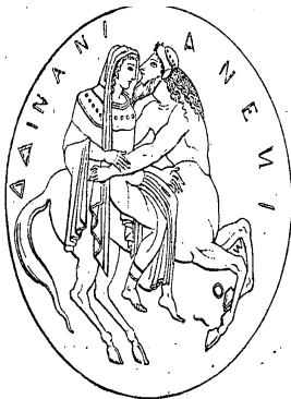
Fig. 615. → Enlèvement de Déjanire (d'après un miroir étrusque).

La aparición de estos retratos anticipa la de Prosas profanas y “encarna la necesidad de estar al día” (Ghiano 1968: 21); tildado de “decadente” y “novedoso” por Paul Groussac en su reseña, 20 no es extraño que el poeta nicaragüense le dedicara el “Coloquio de los centauros” que justamente transfigura la decadencia del centauro de los subtextos franceses —vejez, agonía— en el vigor y exaltación pánicos (Darío 1976 [1909]: 168) sobre un sustrato metafísico, sostén de un ideal poético. Tanto la publicación del libro como manifiesto encubierto y esta dedicatoria indican otra regla del ceremonial del protocolo intelectual en un intento por ubicarse en el campo intelectual porteño.